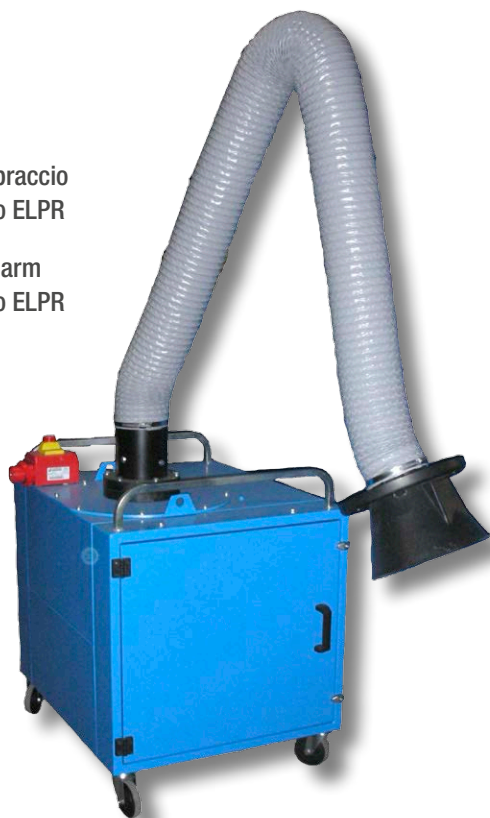
ECODCE with arm Elefantino Eco ELPR