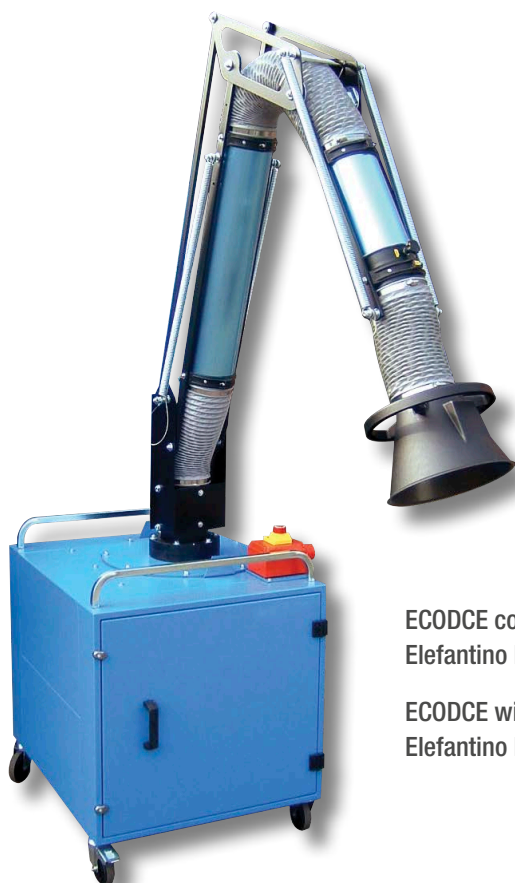
ECODCE con braccio Elefantino ELPR